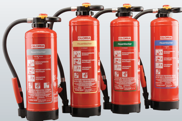
Pulver Schaum Öko-Tipp Wasser