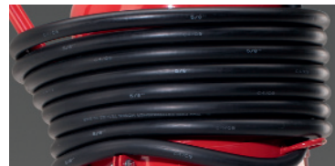
Abb. 1 Große Laufräder Abb. 2 Platzsparende Schlauchunterbringung Abb. 3 Sicherer Standbügel