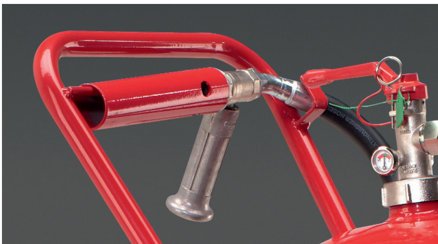
Abb. 4 Abstellbare Angriffseinrichtung